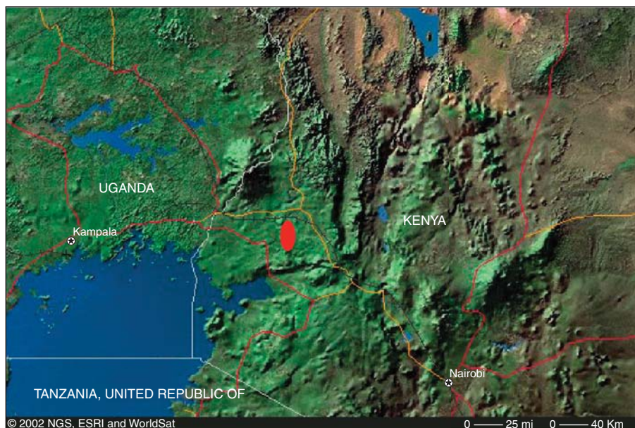
Figure 1. Localisation de la forêt de Kakamega (Ouest kényan) dans le bassin du lac Victoria.

La forêt avait alors une importance capitale : elle était à la fois source de