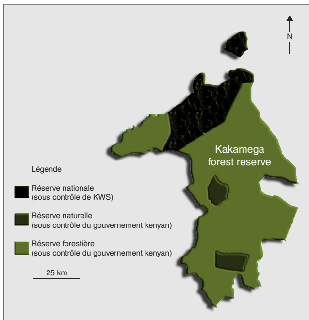
Figure 2. La forêt de Kakamega et les différentes réserves [3].